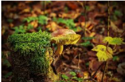
Libre de droit

Infos 02 97 61 01 70 mediatheque@locmine.bzh ;