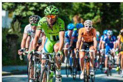
Libre de droit