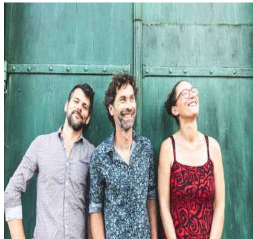
Non libre de droit