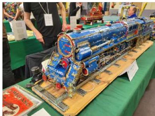
Non libre de droit