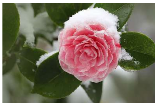
Libre de droit