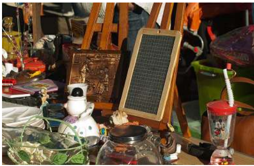
Libre de droit